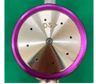
【新開発空気キャップ】